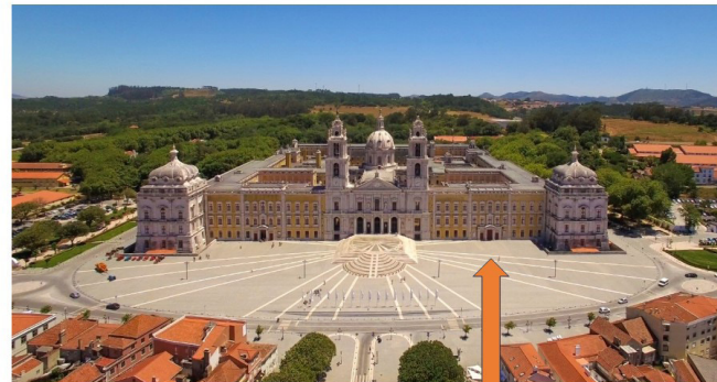
Entrada para o EnIM 2023